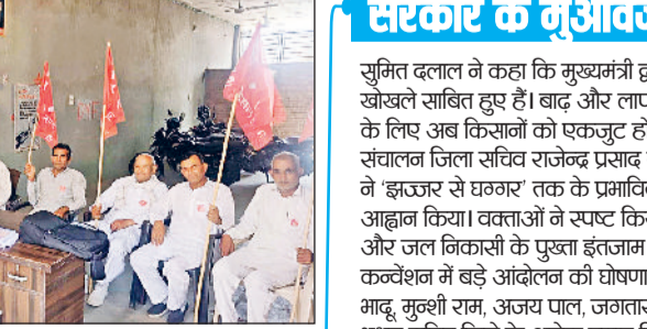
फतेहाबाद। बैठक में भाग लेते किसान सभा के सदस्य।

तक के किसान पिछले लंबे समय से बाढ़, जलभराव और सेम की समस्या से जूझ रहे हैं। उन्होंने प्रशासन से जूझना शुरू किया कि जल निकासी के स्थायी प्रबंधन न होने और ड्रेनों की समय पर सफाई न होने के कारण हर साल किसानों की फसलें