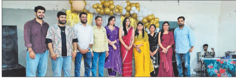
हिसार। छात्रा मीनाक्षी लॉ कॉलेज में आयोजित विदाई समारोह में उपस्थित अतिथि व विद्यार्थी।