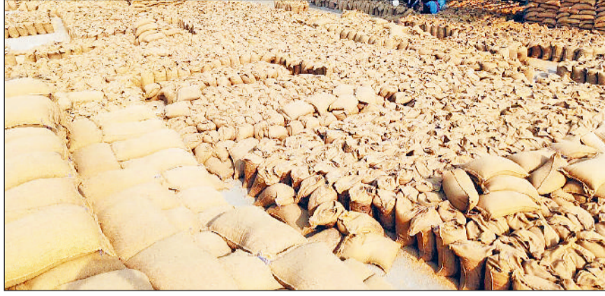
फतेहाबाद। मंडियों में हुई गेहूं की आवक।

मंडी के आदतियों का मानना है कि किसान अपनी गेहूं मंडियों में ला चुके हैं। अब खरीद के बाद लिफ्टिंग का काम शेष बचा हुआ है। उम्मीद है एक सप्ताह तक पूरी गेहूं मंडियों में से उठा ली जाएगी।