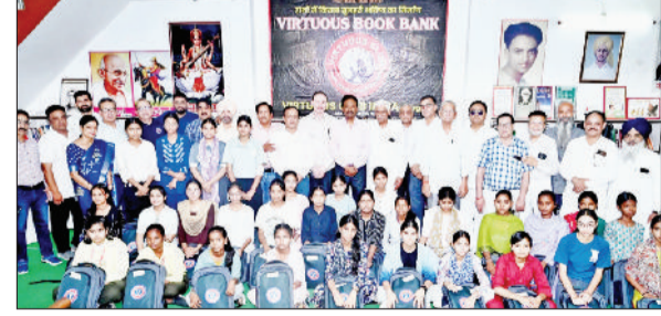
सिरसा। छात्राओं को बुक व बैग वितरित करते वकाल के पदाधिकारी।