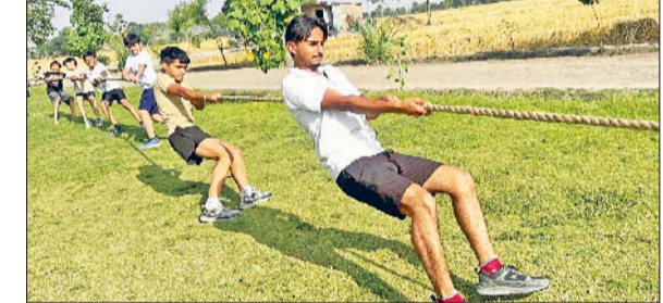
रतिया। खेल प्रतियोगिता में अपनी प्रतिभा दिखाते खिलाड़ी।